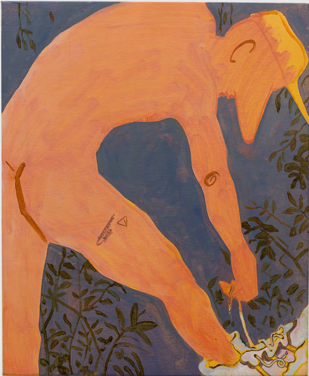
Electronic buda, 2021