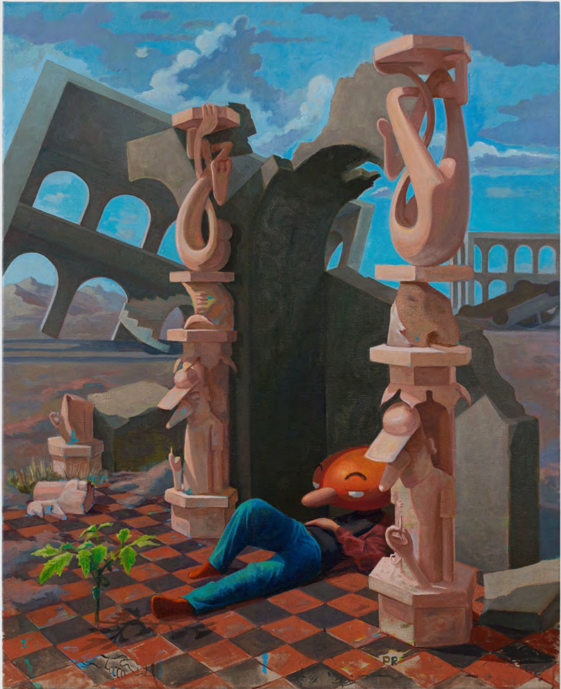
El desastre de perder el astro, 2024