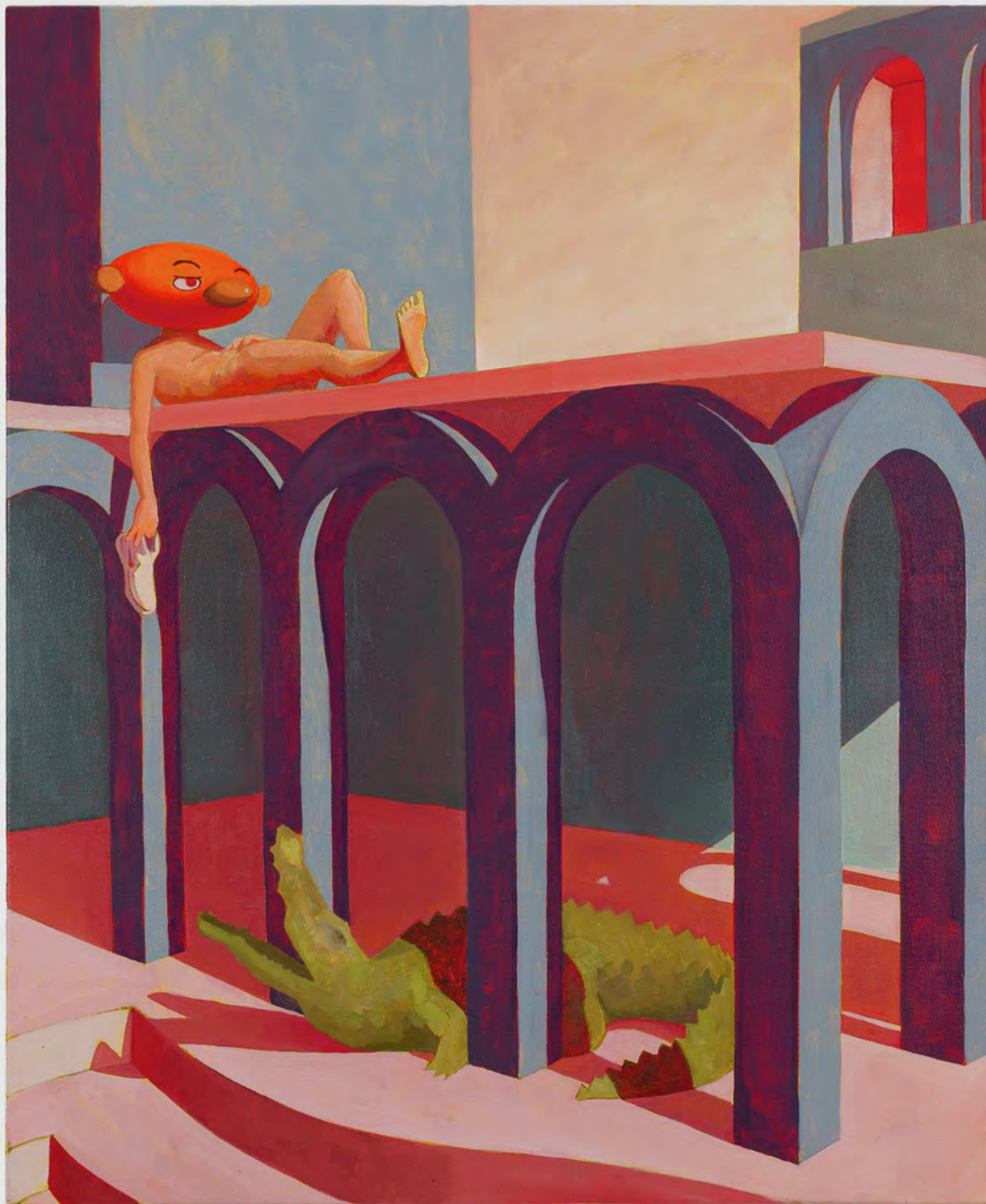
Welcome to the warm Machine II, 2023