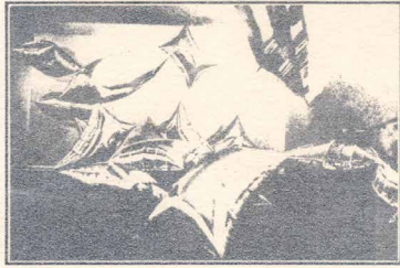
(Fig. 17) Silver Clouds , 1966. (installation at Leo Castelli Gallery, 1966)